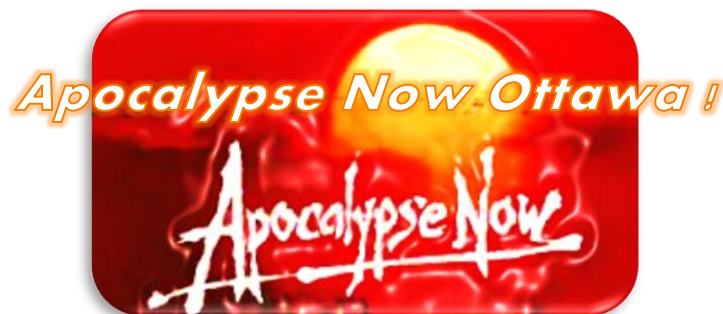
Mise à jour d'une publication du 4/12/18

Mohawk Nation News - 15 décembre 2020 - URL de l'article original ► http://mohawknationnews.com/blog/2020/12/14/apocalypse-now-ottawa-updated-audio/