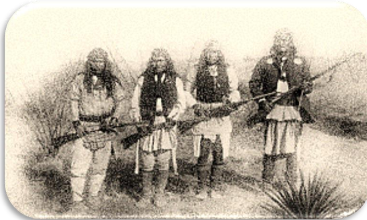
En résistance contre le colonialisme depuis ... 1492 (à droite sur la photo : Geronimo)