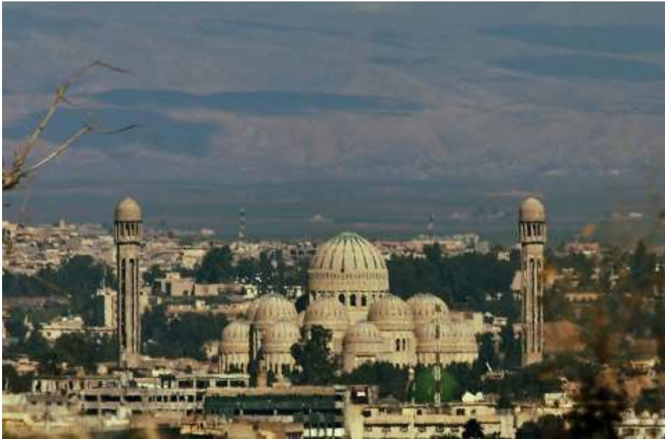
Mossoul avant :