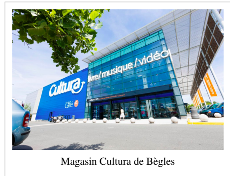
Magasin Cultura de Bègles

En Octobre 2011, le fondateur parti, Sodival entreprend un changement de comité de direction par l'introduction de salariés Cultura au sein de la société Milonga.